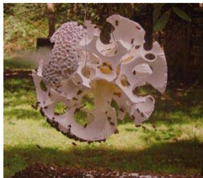
Jef Faes, Zonder titel (2008)

De tentoonstelling Artificial Nature is het eerste grote 'bio art'-project in België. De Verbeke Foundation hecht dan ook zeer veel belang aan begeleiding van en informatie voor de bezoeker. Met de steun van de Zoo van Antwerpen en van het Museum Morfologie van de UGent werd een pedagogische ruimte ontwikkeld om de veranderde historische kijk vanuit de kunst op de natuur te duiden. Binnen de tentoonstelling Artificial Nature wordt een historisch naturaliënkabinet gereconstrueerd. Tot in de 18 de eeuw werden naturaliën (opgezette dieren, gedroogde planten, schelpen...) trouwens samen met kunstvoorwerpen en oudheidkundige objecten bewaard in zogenaamde rariteitenkabinetten. Geen rariteiten in de Verbeke Foundation deze zomer, wel een spannende dialectiek tussen kunst en natuur die vaak uitmondt in prachtige werken.