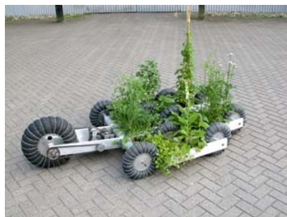
René van Conven, Victor Mobilae (2003)

L'art et la nature s'unissent de nouveau cet été à la Verbeke Foundation : dans le splendide domaine naturel bien sûr, mais surtout grâce et au travers des œuvres. Un cabinet d'histoire naturel, reconstitué en collaboration avec le Zoo d'Anvers et le Musée de Morphologie de l'université de Gent, y sera également à découvrir. Ouverte au public jusqu'au 15 novembre, Artificial Nature entraîne dans son sillage une série d'autres expositions : notamment un projet international aux frontières franco-belge (Watou-Herzele) et belgo-néerlandaise (Kemzeke-Lamswaarde). Plus d'informations suivront dans un prochain communiqué. D'ici là, soyez les bienvenus au vernissage de l'exposition Artificial Nature le samedi 23 mai, dès 18h.